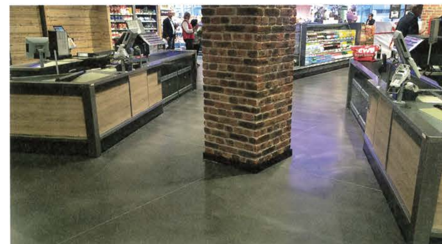
Das Zusammenspiel von ULTRATOP, Backstein und Holz im Kassenbereich.